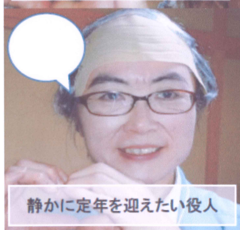
静かに定年を迎えたい役人