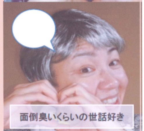
面倒臭いくらいの世話好き