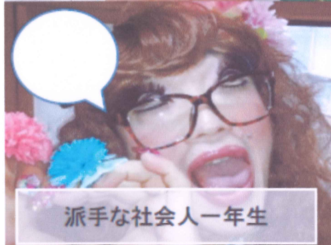
派手な社会人一年生