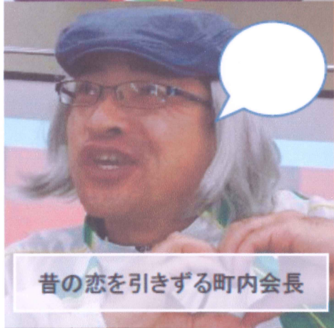
昔の恋を引きずる町内会長