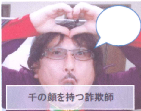
千の顔を持つ詐欺師