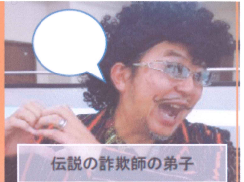
伝説の詐欺師の弟子